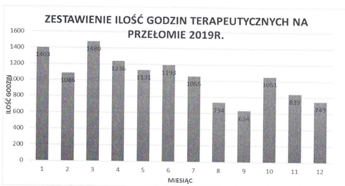
Wykres nr.1 – Zestawienie ilości godzin terapeutycznych w 2019r.

W 2019 r. w Centrum Terapii Fundacji z ASPI-racjami opieką terapeutyczną objętych było 109 podopiecznych w tym 20 to dziewczynki, a 89 stanowili chłopcy. Dzieci korzystające z naszej pomocy znajdują się w przedziale wiekowym od 1 roku życia do 18 roku życia. Łączna liczba zrealizowanych godzin terapeutycznych wynosi 12 591 h, które zostały zestawione na wykresie nr 1.