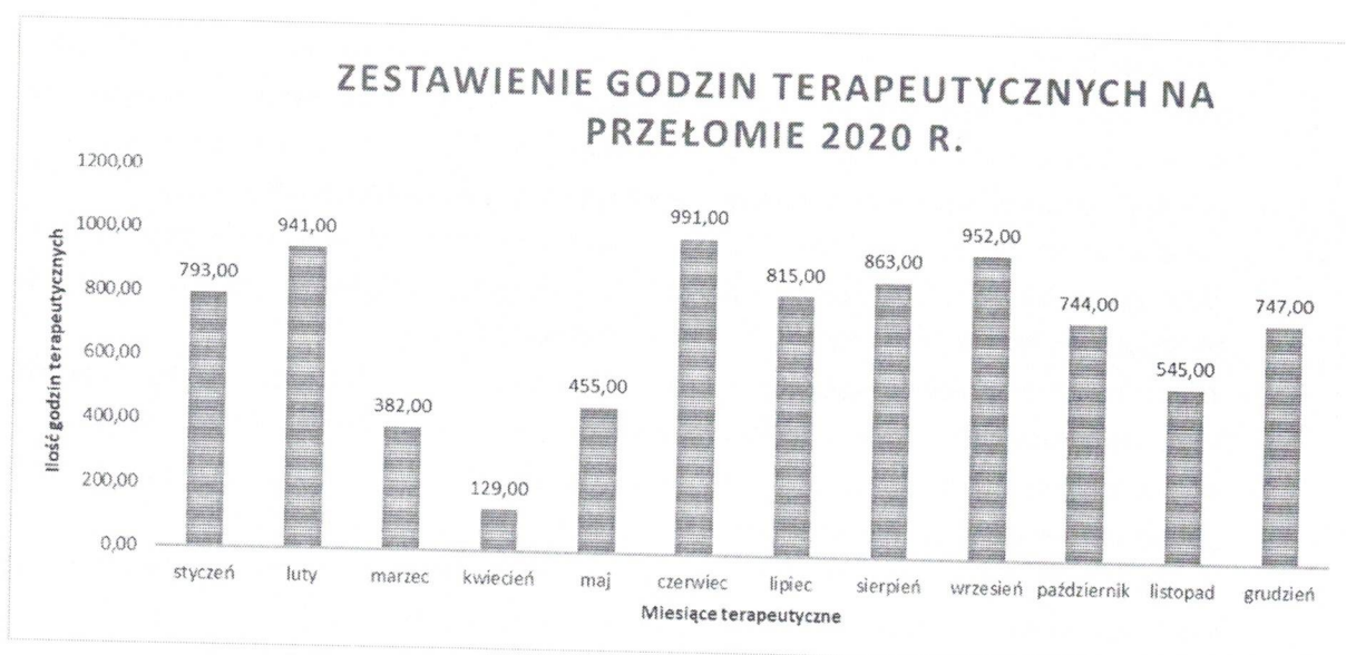
Wykres nr.1 – Zestawienie ilości godzin terapeutycznych w 2020r.

W 2020 r. w naszym centrum opieką terapeutyczną objętych było 131 podopiecznych w tym 19 dziewczynek, a 112 stanowili chłopcy. Dzieci korzystające z naszej pomocy znajdują się w przedziale wiekowym od 1 roku życia do 18 roku życia. Łączna liczba zrealizowanych godzin terapeutycznych wynosi 8357 h, które zostały zestawione na wykresie nr 1.